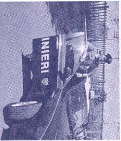
La denuncia raccolta dai carabinieri

VOGHERA. Il lavoro e la presenza del carabiniere di quartiere hanno consentito di porre fine ad una situazione domestica spiacevole. L'opera dell'uomo dell'Arma sul territorio si sta rivelando sempre più importante e funzionale a segnalare ed evidenziare vicende scomode.